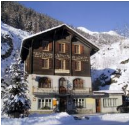
Hotel Breithorn, Blatten im Lötschental

Doppelzimmer mit Du/WC und 2 Einzelzimmer mit Lavabo/ Etagedusche/WC. Die Zimmerzuteilung erfolgt durch die Reiseleitung; für Alleinreisende besteht kein Anspruch auf Einzelzimmer, da je nach Anmeldestand die Einzelzimmer zum Ausgleich (Männlein-Weiblein) benötigt werden.